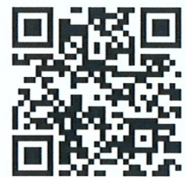
가이드 및 용어집