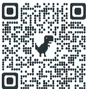
<2024년 프로그램 신청 바로가기>